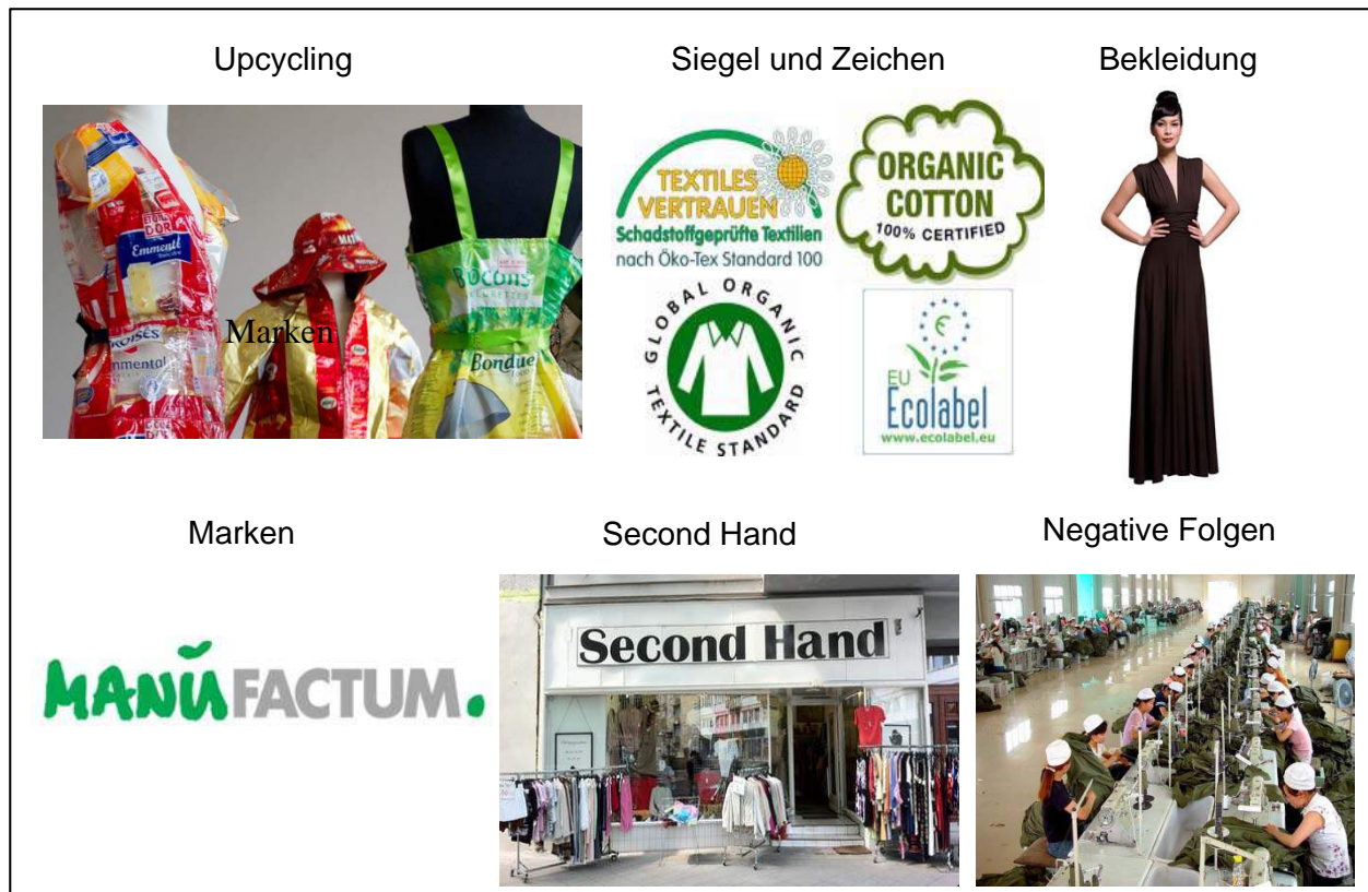
Abbildung 2: Exemplarische Bilder der Probanden zu Nachhaltigkeit in der Modebranche

(18 Stück), zu negativen Folgen (14 Stück) sowie zu Second Hand (8 Stück) mitgebracht. 27 Bilder können als Sonstiges kategorisiert werden, da sie sehr unterschiedliche Themen aufgreifen (wie Natur, Rohstoffe, Bücher usw.).