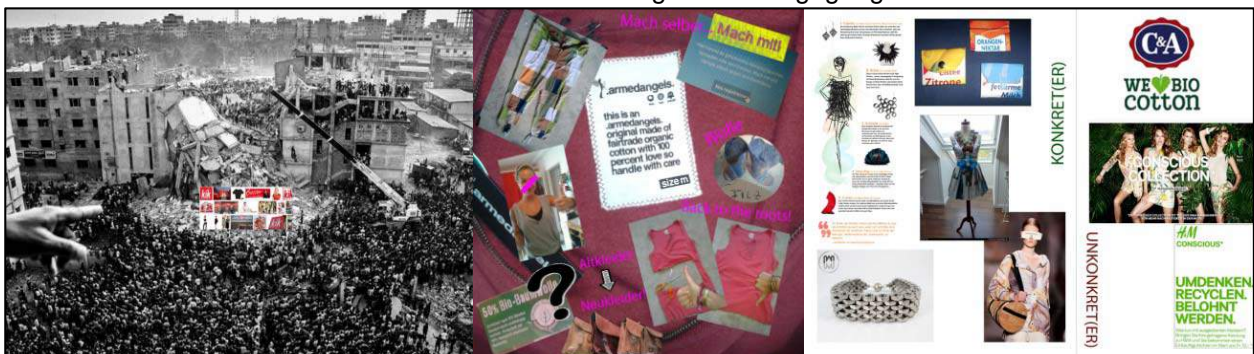
Abbildung 3: Exemplarische Summary Image (Collage)

Der Proband wurde aufgefordert, eine Collage zu kreieren, welche seine Gedanken in Hinblick auf nachhaltige Mode ausdrückt. Das zusammenfassende Bild wurde computergestützt mit den Interviewerinnen zusammen kreiert. Dabei wurden die Bilder unter Anleitung des jeweiligen Probanden ganz neu angeordnet (vgl. Abbildung 3), so dass der bestehende Grundtenor zur Nachhaltigkeit in der Modebranche bestärkt wurde oder eine Zusammenfassung des Vorangegangenen entstand.